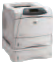
HP LaserJet 4200TN und HP LaserJet 4300TN