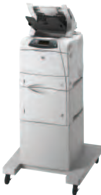
HP LaserJet 4200/4300 mit optionalem Zubehör