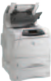
HP LaserJet 4200DTNSL und HP LaserJet 4300DTNSL

Die Drucker der HP LaserJet 4200 und HP LaserJet 4300 Serie bieten professionellen Anwendern sowie kleinen, mittleren und großen Unternehmen die zuverlässige Leistungsfähigkeit eines HP LaserJets, einmalige Vielseitigkeit und bedienerfreundliche Lösungen zur Bewältigung der hohen Druckvolumen in Arbeitsgruppen mit 5-15 Anwendern.