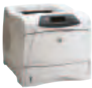
HP LaserJet 4200/N und HP LaserJet 4300/N

Mit ihrer hohen Druckleistung und Druckqualität übertrifft die HP LaserJet 4200/4300 Serie die Erwartungen der Anwender. Die intelligenten, vielseitigen und zuverlässigen Schwarzweißdrucker bieten eine Vielzahl bedienerfreundlicher Funktionen für den Einsatz in Arbeitsgruppen und die einfache Verwaltung der Drucker im Netzwerk.