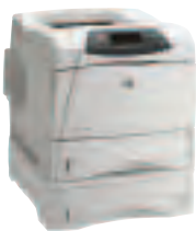
HP LaserJet 4200DTN und HP LaserJet 4300DTN